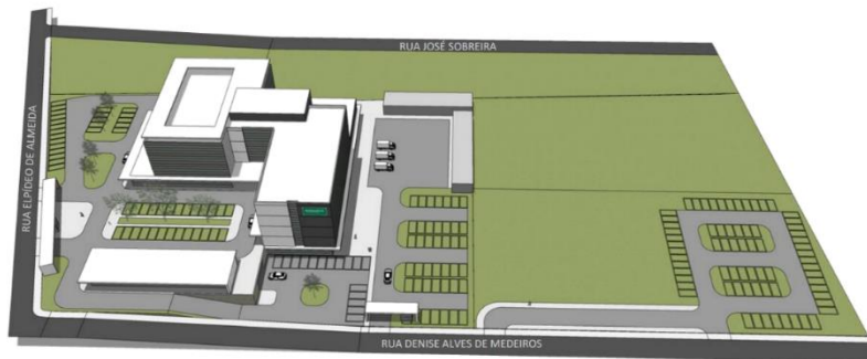
FASE 1 – HOSPITAL